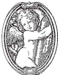
Towarzystwo Bibliofilów Polskich w Warszawie

Muzeum otwarte jest w czwartki w godz. 10–19; a we wtorki, środy i piątki oraz 11 lutego (sobota) w godz. 10–15. Tel. do muzeum (22) 620-60-42; e-mail: muzeum.drukarstwa@mhw.pl ; www.muzeumdrukarstwa.mhw.pl